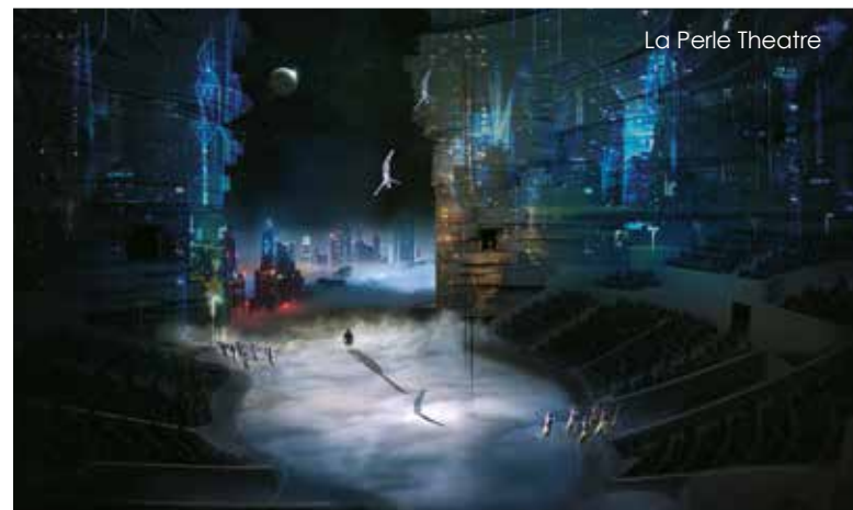
La Perle Theatre